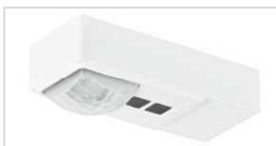
TAS Tageslicht- und Anwesenheitssensor