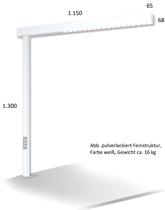
Abb. pulverlackiert Feinstruktur, Farbe weiß, Gewicht ca. 16 kg